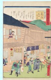
三代広重・ 「東海名所改正道 中記五十 旅人 留女 亀山関迄 売り半」