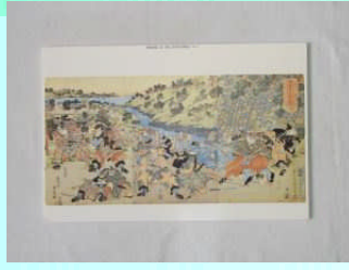
貞虎・ 「昔模様亀山染」