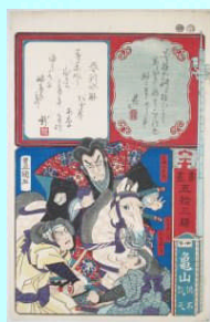
四代豊国・ 「書画五拾三駅 伊勢亀山俱不 戴天」