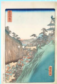
国貞・ 「東海道亀山 （御上洛東海道）」