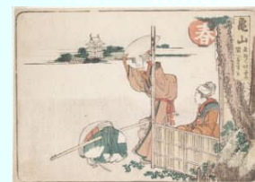
北斎・ 「亀山 関へ 売里半」