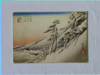
初代広重・ 「東海道五拾三次之内 亀山 雪晴」