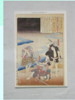
初代広重・ 「忠孝仇討図絵 亀山咄」