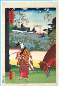
国貞・ 「東海道之内 関 （御上洛東海道）」

市内の亀山・関・坂下を描いた浮世絵です。亀山は城、関は本陣、坂下は筆捨山が多く描かれています。浮世絵は、ほとんどが絵師の想像によって描かれたものですが、例えば、明治になってから描かれた「東海名所改正道中記 旅人留女 亀山関 迄売り半」のように、よく見ると断髪（鬚を切った髪型）の男性が人力車に乗っている姿や洋傘が描かれているなど、その当時の風俗をみることができ、また、当時亀山がどのように認識されていたかを知ることができます。