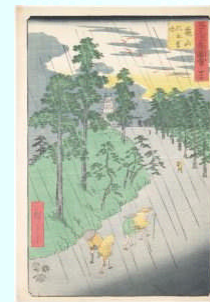
初代広重・ 「五十三次名所図会 四十七 亀山風雨 雷鳴」