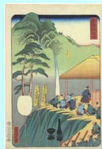
芳虎・ 「東海道坂ノ下 筆捨山（御上 洛東海道）」