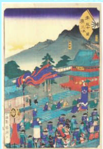
国輝・ 「末広五十三次 関」