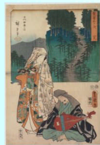
初代広重・三代豊国 「双筆五十三次 関 古代鈴鹿之関」