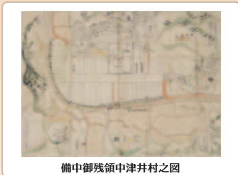
備中御残領中津井村之図