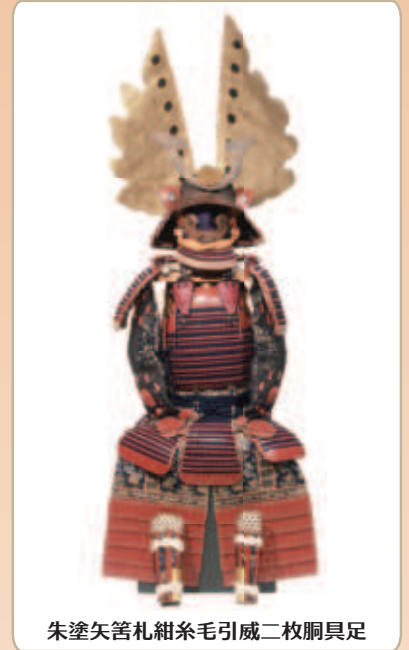
朱塗矢筈札組糸毛引威二枚胴具足