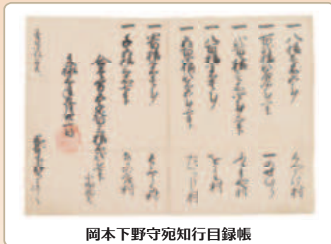
岡本下野守宛知行目録帳