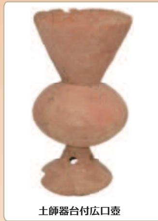
土師器台付広口壺