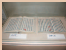
古事記と日本書紀

展示室に並んださまざまな時代の実物や、復元された古墳、城下町の模型もあります。数十年前まで実際に使われていた道具も展示しています。