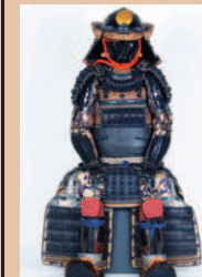
皺革包紺糸胸取威二枚胴具足

展示室に並んださまざまな時代の実物や、復元された古墳、城下町の模型もあります。数十年前まで実際に使われていた道具も展示しています。