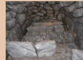
古墳石室の復元模型

常設展示室では、亀山市の通史展示を行っています。小学校・中学校の教科書ともリンクして、地域の歴史を見ることができます。