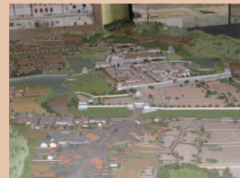
亀山城下町の大型模型