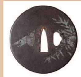
亀山鐔 (笹竹に白鷺図)