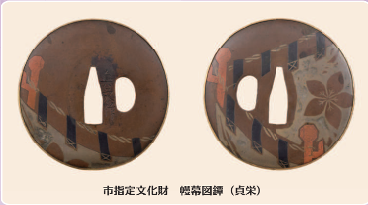
市指定文化財 幔幕図鐔 (貞栄)